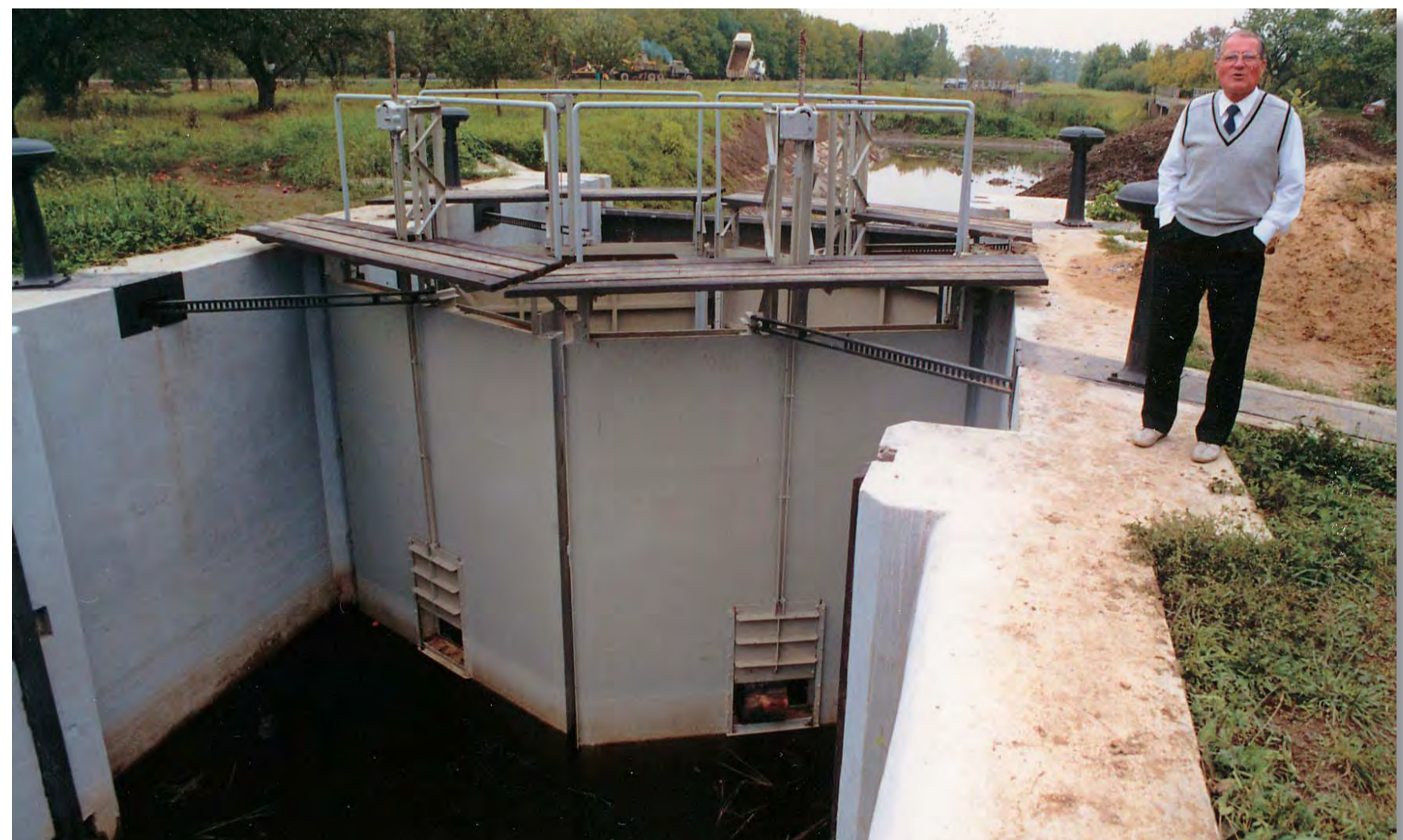
Vratně plavebních komor Strážnice (Česká republika) Lock gates Strážnice (Czech Republic) Ворота шлюза Стражнице (ЧР)