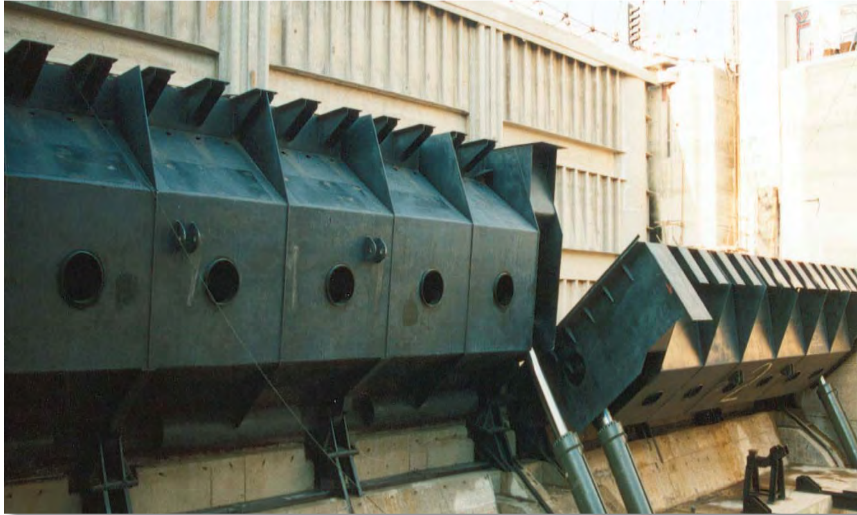
Klapková vrata pro plavební komoru Gabčíkovo (Slovensko) Tilting gates for upstream nose of Gabčíkovo lock chambers (Slovakia) Клапаны шлюза Габчиково (Словакия)