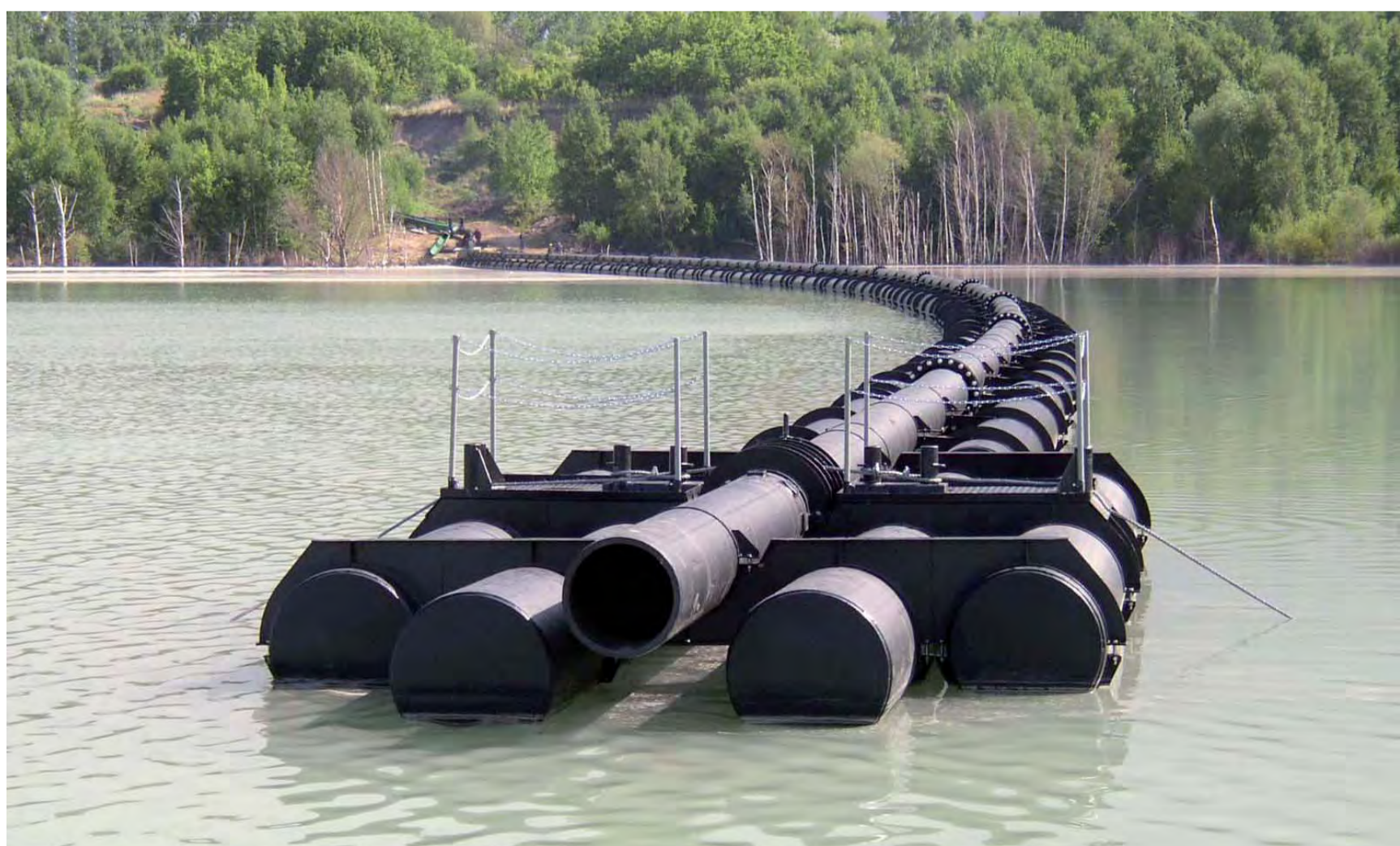
Plovoucí naplavovací potrubí strusky pro odkaliště Chemopetrol Litvínov (ČR) Floating alluvial pipeline for transport slag to settling pit of Chemopetrol Litvínov (Czech Republic) Плывущий намывный трубопровод Хемопетрол Литвинов (ЧР)