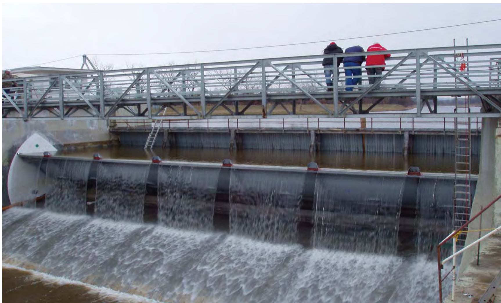
Jezová klapka České Budějovice - České Vrbné (Česká republika) Tilting gate České Budějovice - České Vrbné (Czech Republic) Клапан платины Ческе Будеёвице (ЧР)