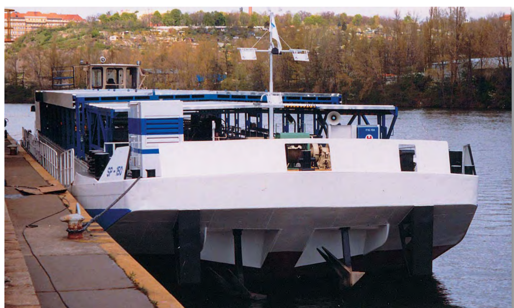
Přestavby plavidel – Servisní loď SP 150 (Česká republika) Construction of vessels – Service vessel SP 150 (Czech Republic) Реконструкция судов – сервисное судно СП 150 (ЧР)